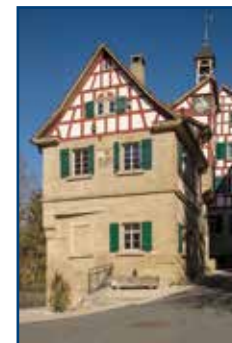
Handwerkerhaus Stuttgart | 18./19. Jh.