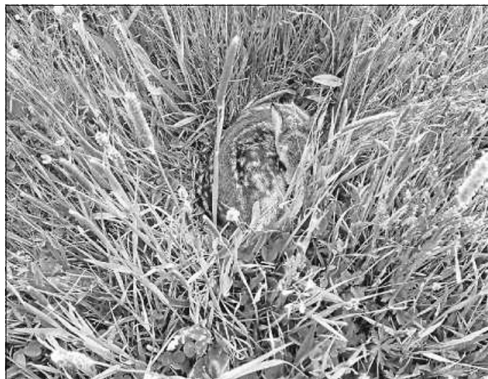
Bei einem ersten Einsatz der Drohnen wurde ein Rehkitz in einer Wiese entdeckt.